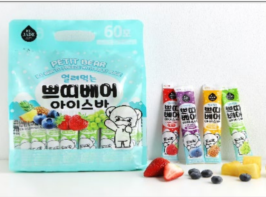
PETIT BEAR ICE BAR