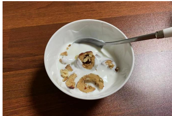
다양한 식용 방법