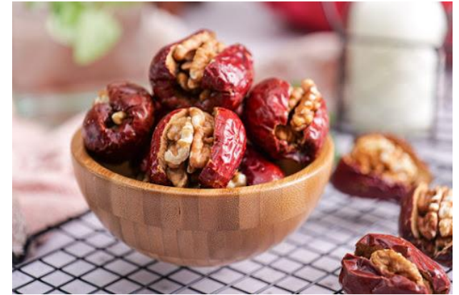
최고의 애프터눈 티 디저트