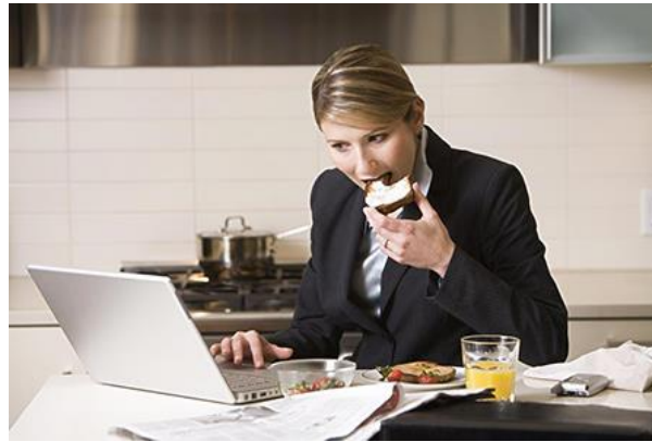
오피스 간식 베스트