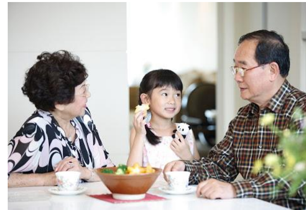
노인이나 아이나 모두 잘 먹는다